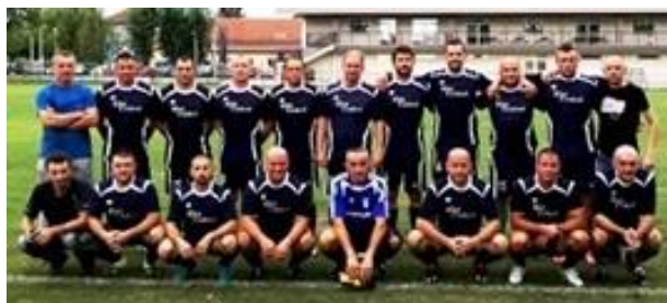
VNK Brezovica (Zagreb) - jesenski prvak

Izviješće 2. liga skupina C za jesenski dio 51. prvenstva veterana ZNS