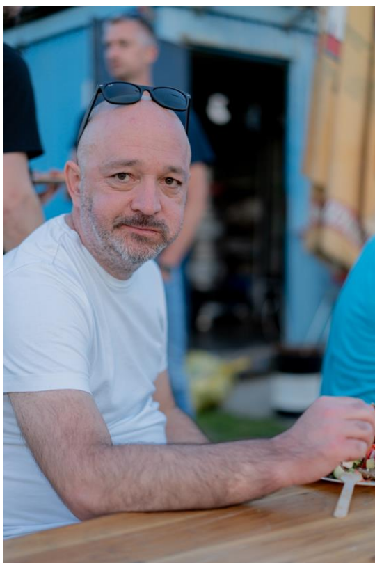
Neki su uživali u klopi